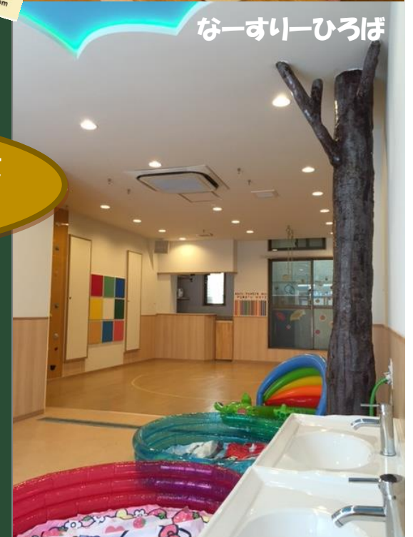
なーすりーひろば